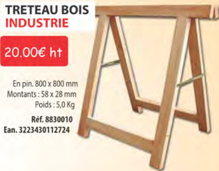
TRETEAU BOIS INDUSTRIE