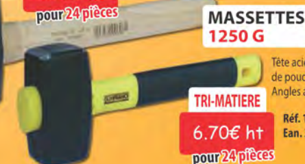
MASSETTES 1250 G