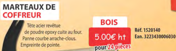
MARTEAUX DE COFFREUR

En acier. Charnières renforcées. Sangle de blocage d'ouverture. Porte-cadenas. Poignées de transport. Dim. 850 x 350 x 350 mm. Poids : 13 kg.