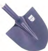
Pelle PERRIN 27