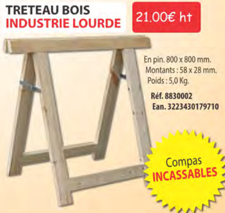
TRETEAU BOIS INDUSTRIE LOURDE