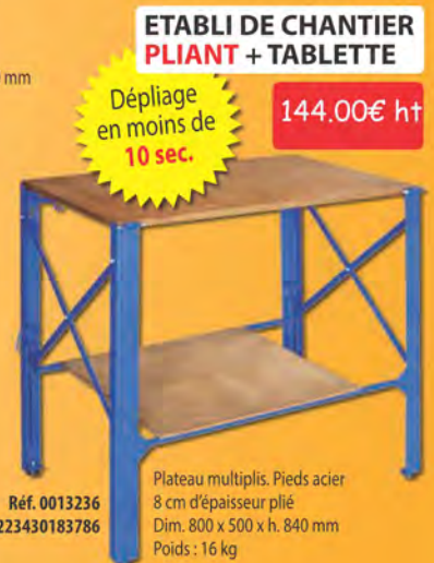
ETABLI DE CHANTIER PLIANT + TABLETTE

Etabli bois massif et multiplis. 2 presses horizontales 2 portes coulissantes 3 tiroirs sur glissières Dim. 1750 x 500 x h. 820 mm Poids : 59 kg Réf. 0013118 Ean. 3223430134498