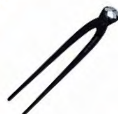
Pince russe de 22