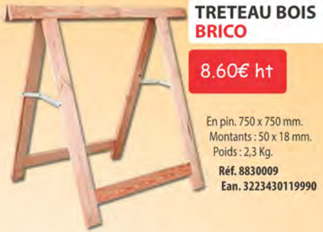
TRETEAU BOIS BRICO