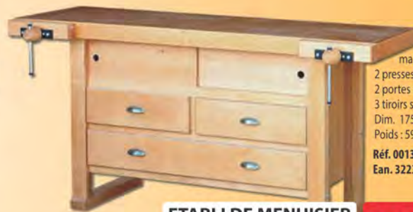
ETABLI DE MENUISIER 1,75 M

En pin. 800 x 800 mm Montants : 58 x 28 mm Poids : 5,0 Kg Réf. 8830010 Ean. 3223430112724