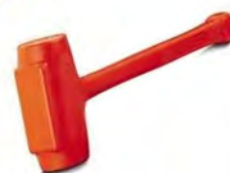
4700gr -76cm -57552