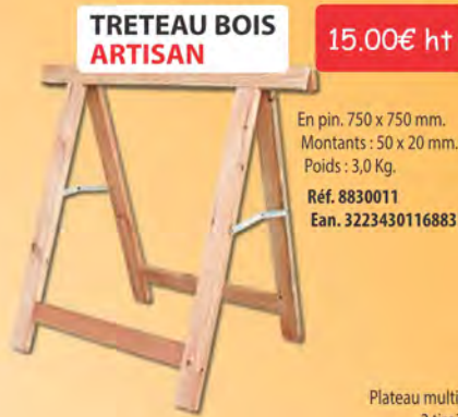
TRETEAU BOIS ARTISAN

En pin. 750 x 750 mm. Montants : 50 x 18 mm. Poids : 2,3 Kg. Réf. 8830009 Ean. 3223430119990