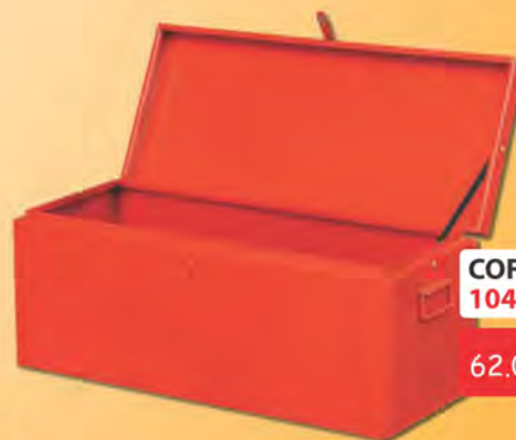
COFFRE DE CHANTIER 104 LITRES