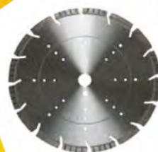
Disque mixte 300mm